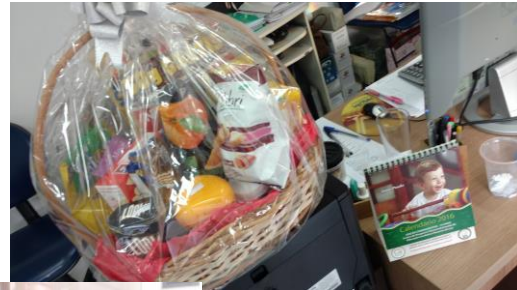
Cesta de Dia dos Pais