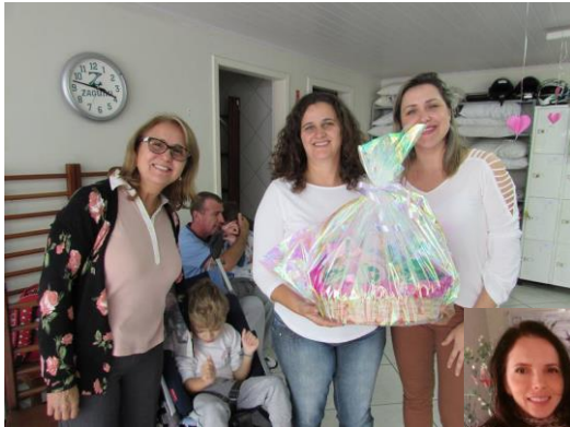
Cesta de Dia das Mães

Em 2016 a Diretoria do Centro de Pesquisa e Desenvolvimento de Educação Conduativa “Pássaros de Luz” promoveu diferentes promoções para captação de recursos e para divulgação do trabalho realizado. A colaboração e o envolvimento de todos os pais garantiram o sucesso dos eventos e atividades durante o ano. As promoções e campanhas são essenciais para a manutenção dos atendimentos diários realizados aos alunos do Centro de Educação Conduativa Pássaros de Luz!