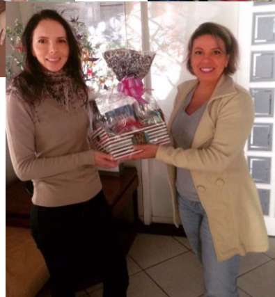
Cesta de Dia dos Namorados